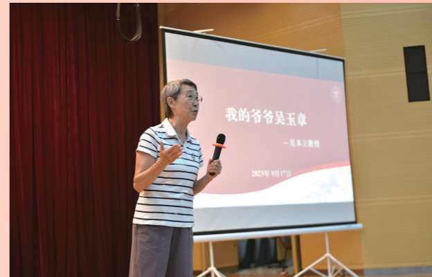
2023年9月，吴本立教授在苏州校区讲述《我的爷爷吴玉章》，通过视频连线的方式与在法国合作高校学习的“留育人2.0”工程的学生代表对话，带领中法学子对话百年前的先锋分子。

聚焦校区办学特色，赋能区域高质量高水平发展。做好苏州与法国文化互动的桥梁与连接，共同推动中法人文教育交流、开展经贸合作。开发特色培训课程，为苏州党政干部、企业骨干提供优质服务。引导人大本部与苏州校区学子在苏州和长三角地区学习、就业、创业，在打造全国重要人才中心和新高地中展现人大担当、贡献人大力量。