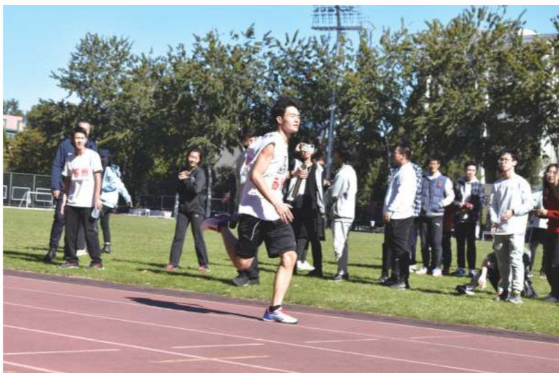
名参加并组织选拔，为同学们做好后勤保障工作。运动健儿们在高强度学习的同时，每周参加两次培训，不断提高自己竞技水平，在人大赛场上展现了苏州校区学子顽强拼搏、奋发自强的运动品质和精神风貌。

自10月初开始，校区积极组织2021级新生筹备参加新生运动会，为同学们争取了专业的训练场地，并聘请专业教练进行培训。学生会积极动员新生报