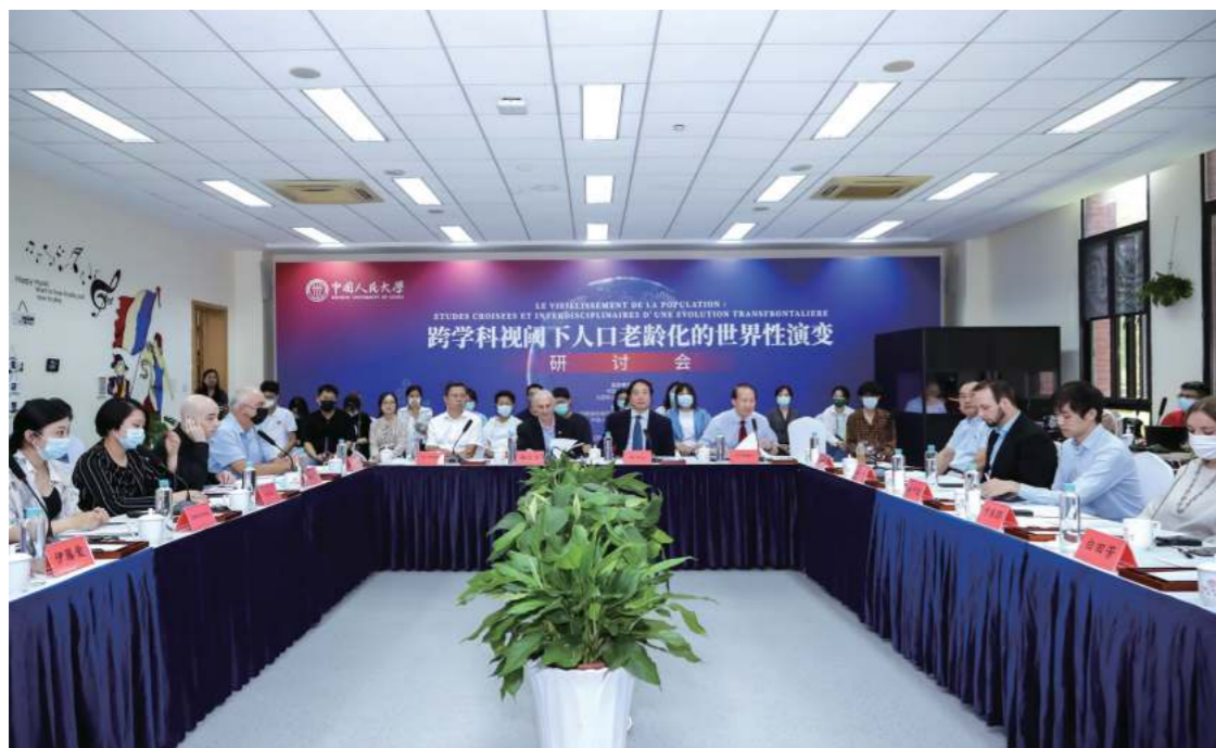
9月24-25日，“跨学科视阈下人口老龄化的世界性演变”国际学术研讨会以线上线下相结合的形式在中国人民大学苏州校区召开。本次会议由中国人民