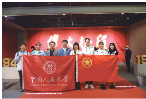
“伟大征程”特展合影

在京期间,苏州校区分团委团学骨干积极开展党史校史学习活动。团队一行前往首都博物馆、中国人民大学老校区、博物馆和校史馆进行“迎建党百年”主题参访调研。