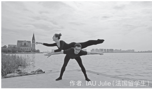
作者: IAU Julie (法国留学生)